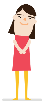
PERSONAS DE RECIENTE RESIDENCIA EN NUESTRO PAÍS

Según el INE, la previsión es que el porcentaje de mayores de 65 años alcance 1/3 de la población española en 2049.