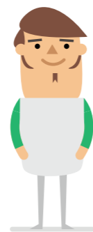
PERSONAS CON PROBLEMAS DE APRENDIZAJE

Más de 65 millones en 2014, batiendo récord por tercer año consecutivo, según el INE.