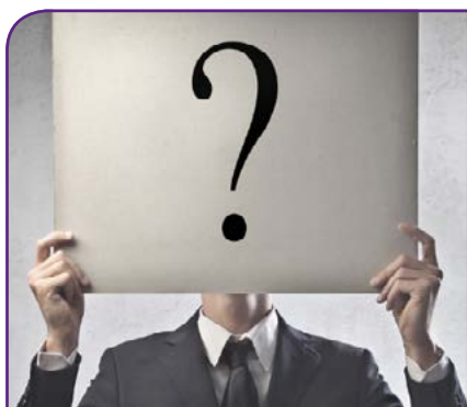
Un político de tu entorno